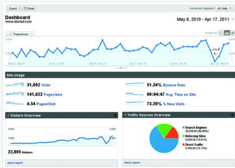
میزان بازدید از بخش های متفاوت پورتال دستاد از ۲۲ تیرماه ۱۳۸۹ تا انتهای فروردین ماه ۱۳۹۰